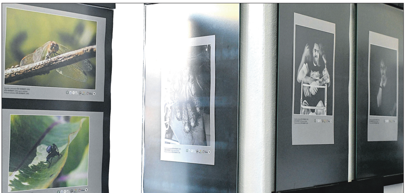
A Metamorfózis című kiállítás keretében a közönség az állatvilágot bemutató ciklusokat láthatott