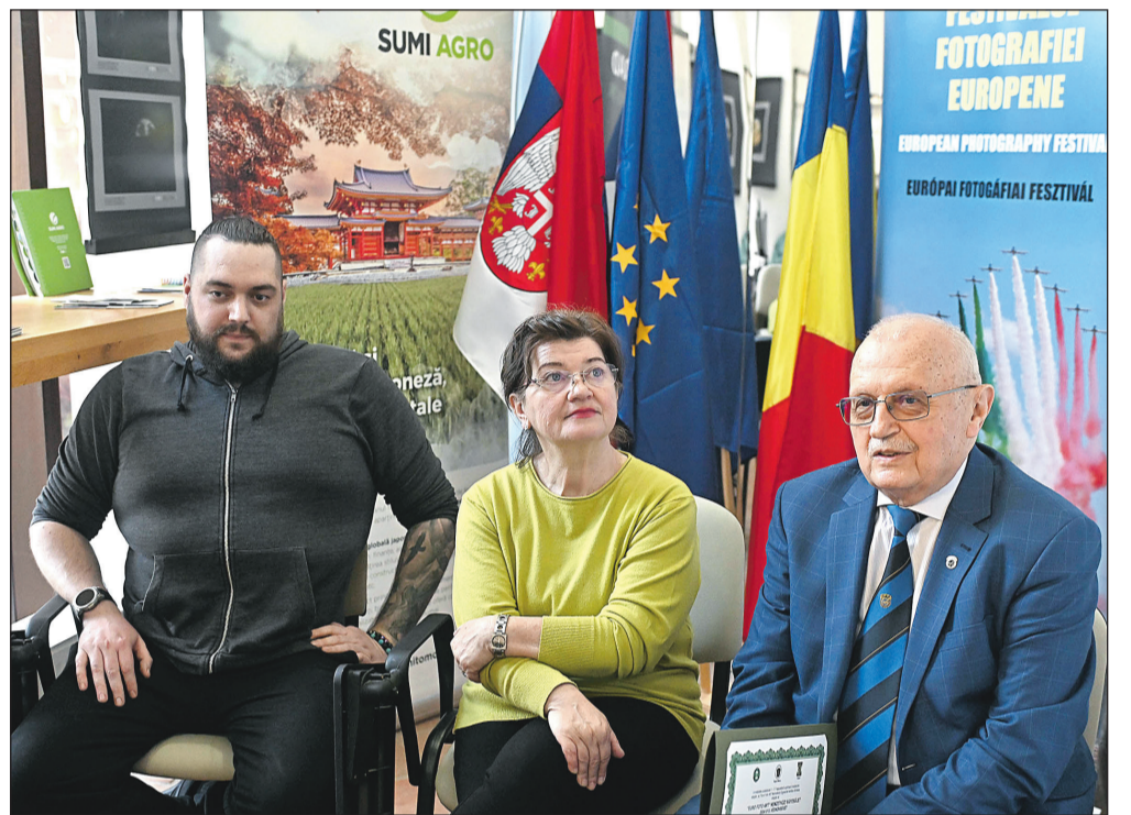
Hős Norbert: A fénykép módja annak, hogy a világot más szemmel lássuk és megosszuk másokkal